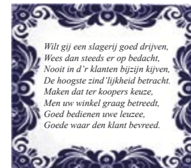
"Handboek voor de slager", 1935.